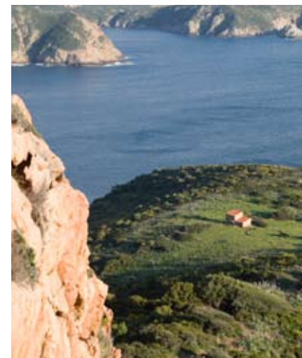
Du haut de la falaise de porphyre rouge, l'aire à blé