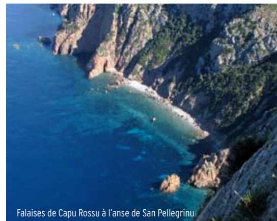
Falaises de Capu Rossu à l'anse de San Pellegrinu

Vol de martinets pâles et de grands corbeaux au-dessus de pelouses à cyclamen renforcent ici le sentiment d'être à l'extrémité du pays du vent. Digne de l'implantation vertigineuse des châteaux cathares du Languedoc, la tour génoise de Turghiu est la plus élevée de la « Terre des quatre tours ». Bâtie au bord d'une falaise de plus de 300 mètres de haut, elle offre à 360 degrés à la ronde une vue époustouflante sur le paysage environnant et sur ses trois sœurs : les tours d'Omigna, Orchinu et Cargèse.